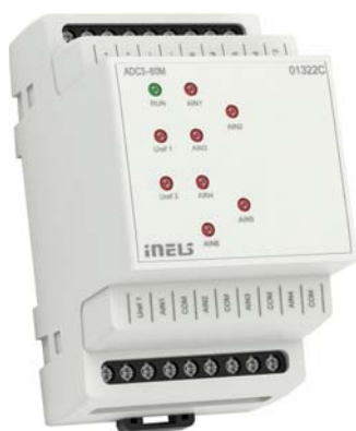
EAN kód ADC3-60M: 8595188133012