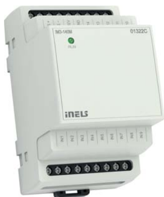
EAN kód IM3-140M: 8595188132459